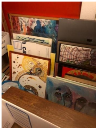
Kunstwerken in opslag